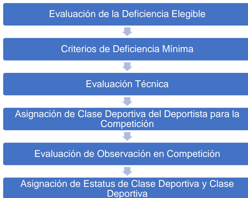
Figura 1: El Proceso de Evaluación del Deportista

Deportiva superior/menos perjudicada, p. BC1 compitiendo como BC2, permanecerán en esa Clase Deportiva por el resto de la Competición FEDPD.